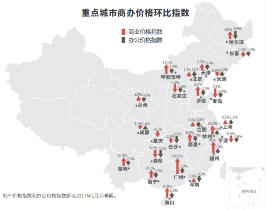
重点城市商办价格环比指数