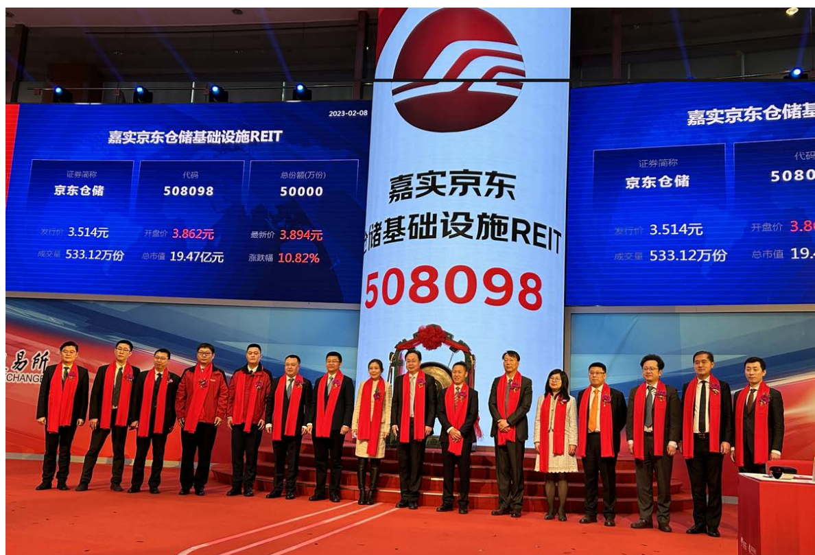
嘉实京东仓储REIT正式在上海证券交易所上市。

2月8日，首只民企仓储公募REIT正式在上海证券交易所上市。据披露文件显示，该仓储基础设施REIT基础设施资产包括位于重庆、武汉和廊坊的3处物流园区，合计建筑面积350,995.49平方米。项目资产出租率均达到100%，即满租状态，租约长度为5至6年。嘉实京东仓储REIT正式在上海证券交易所上市。