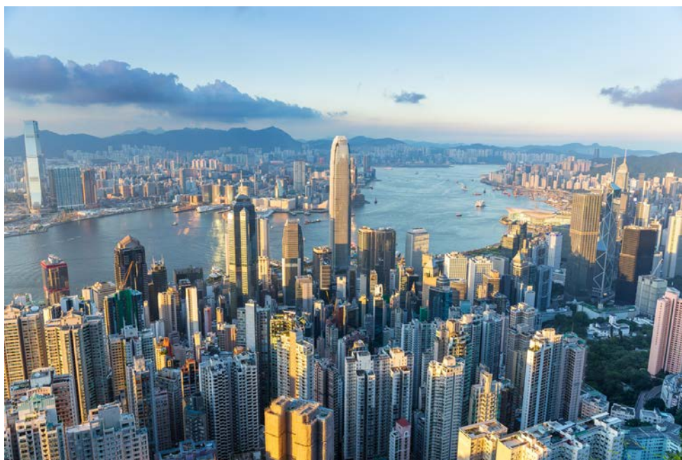
从山顶拍的维多利亚港。